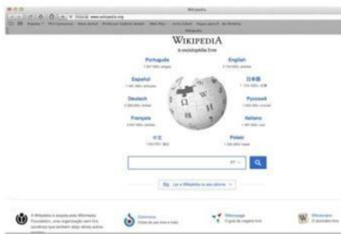
Print da página inicial da Wikipédia em português.